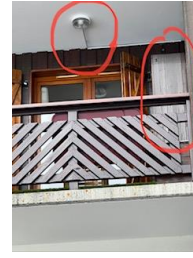
Appt n° 126