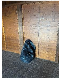
Cage D dernier étage